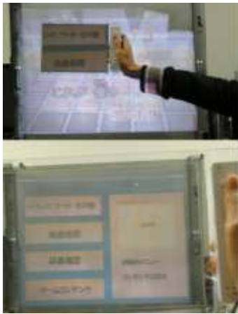
図 2:「Fill-Con」を用いた操作画面