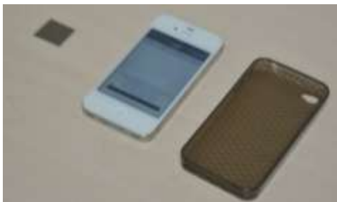
図 4: 偏光フィルターアタッチメントの内訳

この手法を実現するに当たり、スマートフォンのカメラに隠蔽されたコードを読み取らせる。一般的なスマートフォン(ios)に一般的なケース、そして直線偏光フィルターの一片を用いたアタッチメントを装着するだけでスマートフォンカメラを、人間の視覚で認識することのできない直線偏光の光を見ることが出来るカメラデバイスとして使用することができるようになる(図 4)。