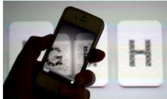
図 5: AR キーボードとカメラデバイス

今回はプロトタイプとして、QRコードのマトリックスによってキーボードを構成するコードを配置することで、キーボードをAR化することに成功した(図 5)。これにより、ディスプレイをタッチするようにしてテキストの入力を行うARキーボードが可能になった。