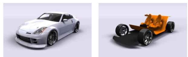
図 6: 原画 (A, B)

結果は、図 9 のように裸眼では全く隠蔽映像を確認することが出来ず、図 10 のように偏光メガネにより確実に隠蔽されていることを確認した。