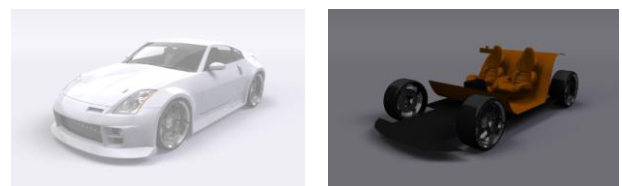
図 7: 処理後の画像 (A', B')