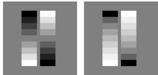
図 4: テストチャート (ガンマ考慮なし (左)、考慮 (右))

2.2 を考慮して設定したテストチャートを用いることで 1 本の境界のない白を得ることができた (図 5 右)。これは、全面白 (255) の画像にテストチャートを隠蔽することと等価である。カラーにおいても同様であり、ガンマ及びプロジェクタのカラー空間を考慮した補完関係を導出する必要があることが確認できた。