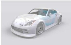
図 8: 差分画像 (C)