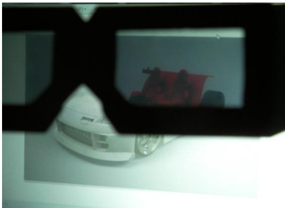
図 10: メガネを通した隠蔽画像(車体の内部が観察できる)