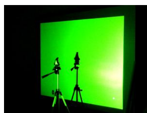
図 2: プロジェクタ (2 台) 図 3: Spyder3 による測光