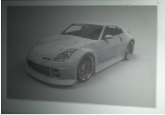
図 9: 裸眼画像結果