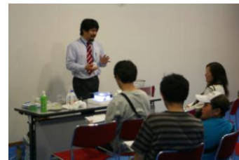
【図3：霧箱を使ったワークショップの様子】

活動や研究の一端として、2011年5月21日(土)に行われた神奈川県青少年センターと神奈川工科大学主催の「科学のひろば」というイベントにおいて「霧箱を使った自然放射線の可視化」という科学コミュニケーション・ワークショップを設計、実施した。